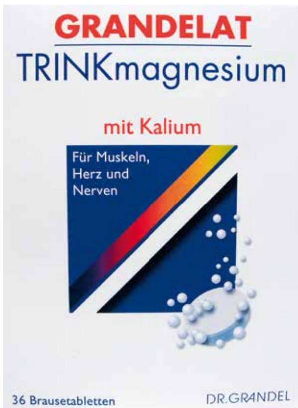
Abbildung 7: Werbeaussagen auf der Vorderseite eines magnesiumhaltigen Nahrungsergänzungsmittels (GRANDELAT TRINKmagnesium mit Kalium)

Beispiel: „TRINKmagnesium mit Kalium – Für Muskeln, Herz und Nerven“ (Abb. 7)